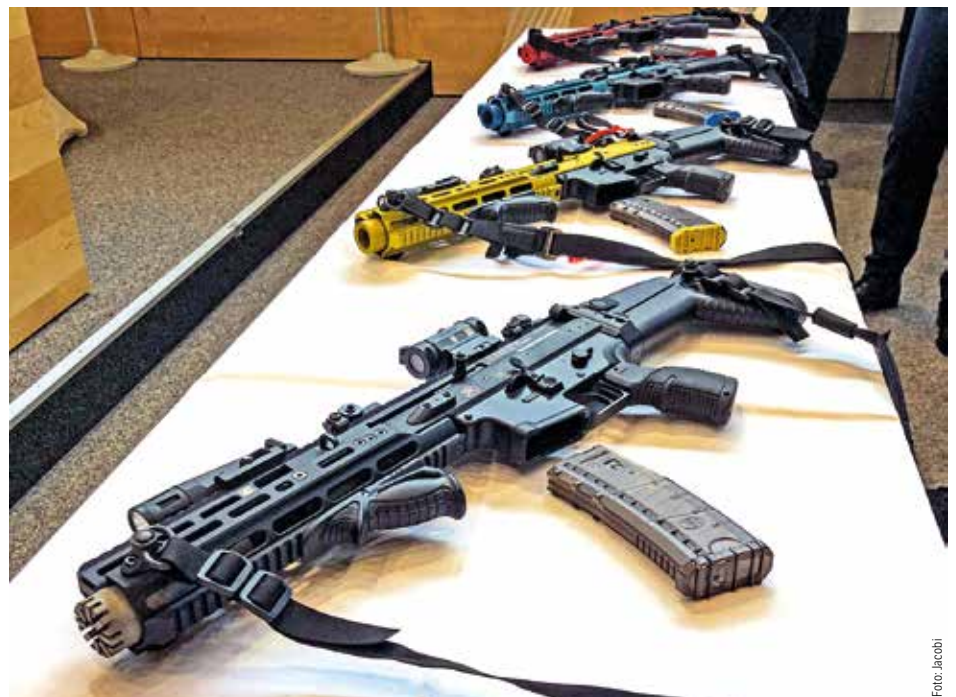
Die Versionen der neuen MP

legen und Kollegen. Die Andeutung des Innenministers zu einer vorgesehenen Umstellung der Dienstpistole P10 nimmt die Gewerkschaft dahingehend zunächst zur Kenntnis und will auch diesen Beschaffungsprozess aktiv begleiten. ■