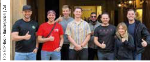
Junge-Gruppe-Nachwuchsseminar in Bamberg