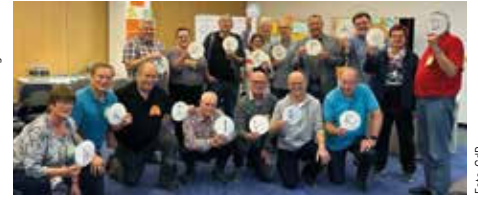
Seminar „Seniorenarbeit aktiv gestalten“