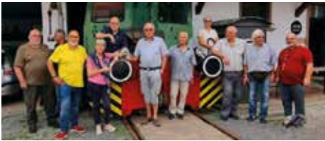
Ausflug des Seniorenverbundes