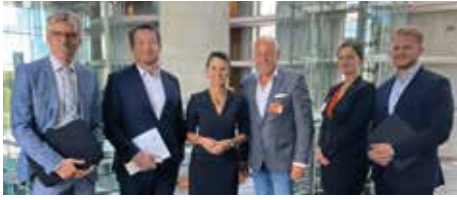
Politischer Termin im Paul-Löbe-Haus