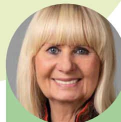
Iris Spranger Vorsitzende der Innenministerkonferenz und Senatorin für Sport und Inneres des Landes Berlin

Mit Beginn des Bundeskongress tritt die 1992 in Braunschweig beschlossene neue Satzung in Kraft. Damit besteht ab sofort die Frauengruppe (Bund).