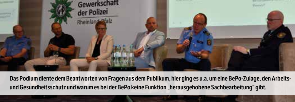
Das Podium diente dem Beantworten von Fragen aus dem Publikum, hier ging es u.a. um eine BePo-Zulage, den Arbeits- und Gesundheitsschutz und warum es bei der BePo keine Funktion „herausgehobene Sachbearbeitung“ gibt.