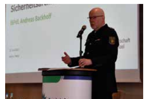
Der Inspekteur der Bereitschaftspolizeien der Länder veranschaulicht die finanzielle Lage im Bund, von der maßgeblich die Versorgung der Länder abhängt. Ein Beispiel: Die Sonderwagen müssen in allen Ländern neu beschafft werden.