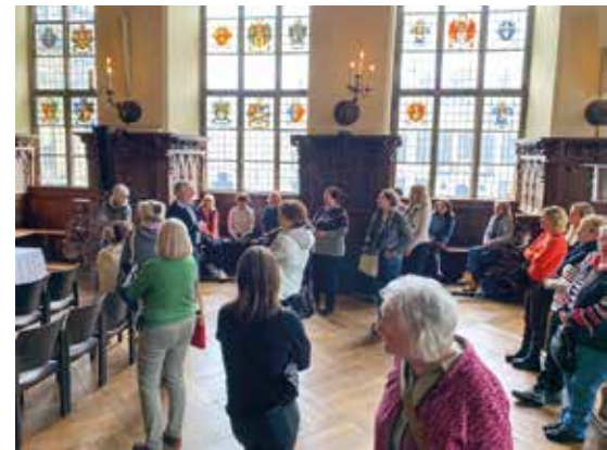
Besichtigung des Bremer Rathauses

Die insgesamt vier Tage waren prall gefüllt mit Besichtigungen der Stadt, dem be-