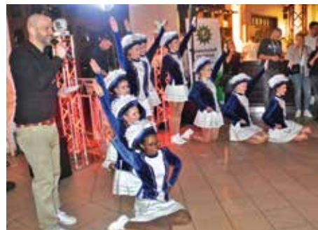
Die Juniorengarde der Karnevalsgesellschaft Kespel Emsbüren sorgte für gute Stimmung in der Tanzgalerie.

Als Special Event heizte die Juniorengarde der Karnevalsgesellschaft Kespel Emsbüren die Stimmung richtig an. Die Tänze-