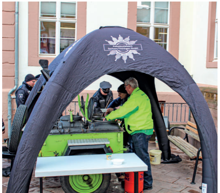
Erbsensuppe aus der Gulaschkanone – immer ein Genuss