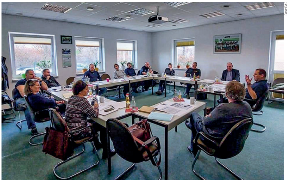
Gemeinsame Sitzung in der Geschäftsstelle

Nach Auswertung der Tagung auf Bundesebene und einer Gesprächsrunde zu aktuellen Themen nahmen sich die Teilnehmer die Anträge des letzten Delegiertentages vor. In einer der letzten Sitzungen des LBV wurden den offenen Anträgen Verantwortliche zugeschrieben. Die FA Schutz- und FA Verkehrspolizei wurden mit insgesamt fünf Anträgen bedacht. Um hier effizienter zu arbeiten, haben sich Mitglieder der beiden Fachausschüsse bereit erklärt, federführend bei einzelnen Anträgen zu agieren. Jeder konnte sich hier nach seinen Möglichkeiten und Fähigkeiten einbringen.