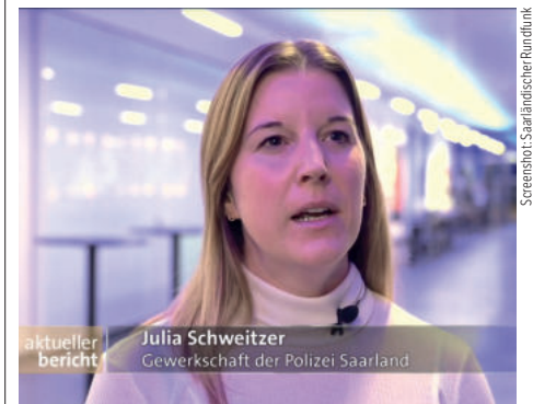
Screenabot: Saarländischer Rundfunk

In der zurückliegenden Silvesternacht kam es zu zahlreichen Angriffen auf Einsatzkräfte.