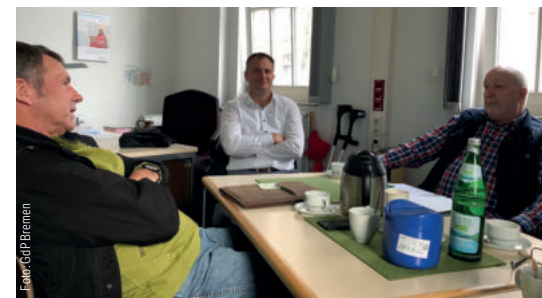
Treffen mit der Seniorengruppe Bremerhaven

Wir alle können in vielerlei Hinsicht dazu beitragen, um die Bedarfe der Senior:innen zu erfüllen. Die Interessen der Senior:innen sind eben doch ein Stück weit andere. Insbesondere müssen wir unsere Netzwerke weiter ausbauen. In diesem Zusammenhang wurden die deutlich verbesserten Informationen an die Mitglieder sehr gelobt. Außerdem werden die angebotenen Seminare „Fachgruppenseminar“