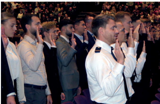
Anwärterinnen und Anwärter der Kriminal- und Wasserschutzpolizei hoben die Hand zur Eidesabgabe.