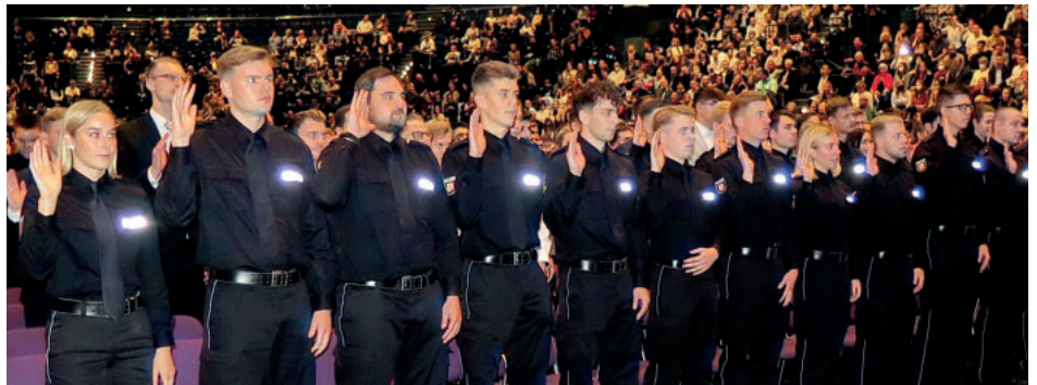
Feierlich legten die Nachwuchspolizistinnen und -polizisten den Amtseid ab.

mit persönlichen Worten an die Angehörigen der Anwärterinnen und Anwärter, vor allem aber auch an die Nachwuchspolizistinnen und -polizisten direkt wandte.