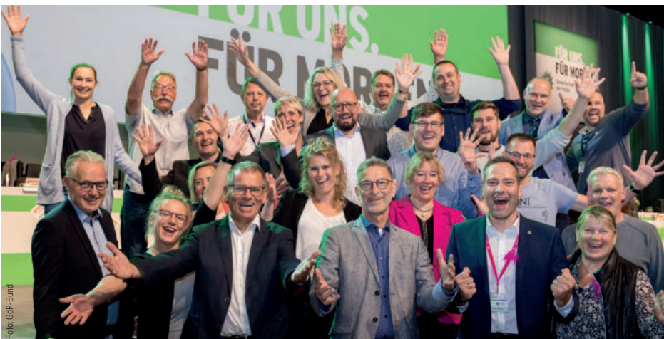
Unter den 23 schleswig-holsteinischen Delegierten herrschte beim Bundeskongress fröhliche Stimmung, die sich auch auf den neu gewählten Bundesvorsitzenden Jochen Kopelke und dessen Vorgänger Oliver Malchow übertrug.

„Ein solcher ‚Tag der Polizei‘ böte der Gesellschaft und der Politik die Möglichkeit, ihre Wertschätzung gegenüber der Polizei zum Ausdruck zu bringen. Im Gegenzug kann die Polizei an diesem Tag zeigen, dass sie in der Mitte der Gesellschaft verankert ist. Durch die Symbolik des 1. 10. als Notrufnummer ist dieses Datum einprägsam und stellt den Bezug zur Polizei her“, lautete die Begründung, die die Kongressdelegierten überzeugte. Mit einem weiteren Antrag aus Schleswig-Holstein wird der GdP-Bundesvorstand aufgefordert, sich für eine Erweiterung des ständigen Angebotes der Einsatzverpflegung in geschlossenen Einsätzen um eine vegane Komponente einzusetzen.