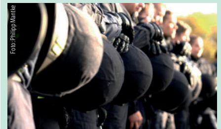
Einsatzhelme geschlossener Einheiten in Niedersachsen

Bereits einige Tage später erfuhr ich im dienstlichen Kontext, dass die Thematik „frischen Wind“ erfährt – vielen Dank für die Unterstützung! ■