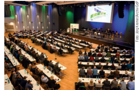
Der 31. Landesdelegiertentag fand 2017 in Osnabrück statt.