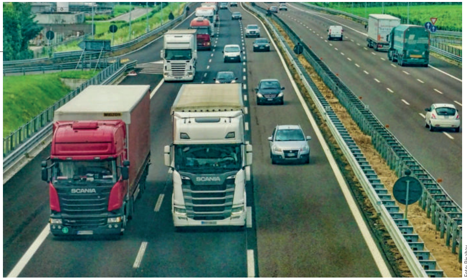
Für alle Autobahnen in Rheinland-Pfalz sollen Fahndungseinheiten eingerichtet werden

Auch in Sachen moderne Ausstattung konnten wir einiges erreichen. Ein Projekt des Innenministeriums hat sich mit der praktischen Erprobung einer neuen Generation teilstationärer Geschwindigkeitsmesssysteme befasst, die wesentlich flexibler einsetzbar sind als die bisherigen Geräte. Dabei war es wichtig, die Anwenderinnen und Anwender miteinzubeziehen und die Erfahrungswerte