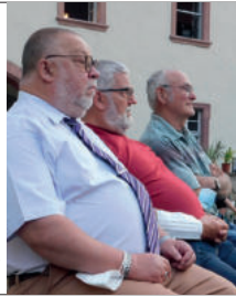
Gespannte Aufmerksamkeit ...