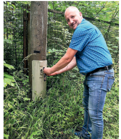
Der Autor hat selbst mit Hand angelegt.