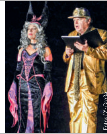
... für Hera und Zeus