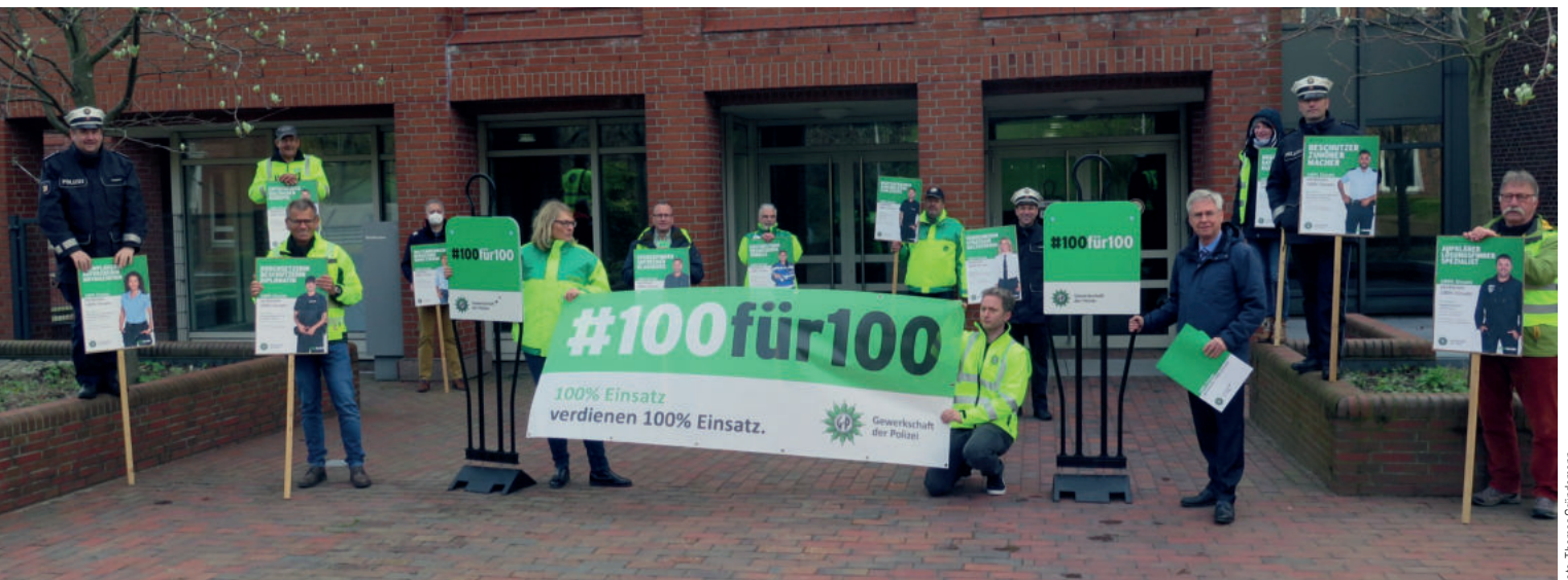
Öffentlichkeitswirksamer Kampagnenstart der GdP Schleswig-Holstein vor dem Innenministerium

Eine große Mehrheit der Befragten (83 Prozent) einer von der GdP in Auftrag gegebenen Umfrage des Markt- und Sozialfor-