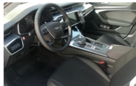
In der Mittelkonsole sind zwei große Bildschirme verbaut, beide mit Touch Display. Hier können die fahrerseitigen Angebote abgerufen werden wie Karte, Radio, Medien und das Telefon, das zweite Display dient der Eingabe für die Navigation.

Weitere Sicherheitsfeatures sind die Fußgängererkennung, Bremsassistent