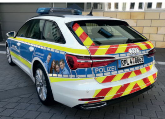
Zusätzliche Beklebung mit gelber retroreflektierender Folie wie beim A 4

Die ersten FustW Audi A 6 sind da, wie üblich wurden sie durch den Innenminister bei einem Pressetermin vorgestellt. Die Fahrzeuge können sich sehen lassen, geballte 170 kw unter der Haube, Antrieb auf allen vier Rädern, wie von der GdP seit mehreren Jahren gefordert. Die Quattro-technik stammt bei Audi aus dem Ralleysport und sorgte dort für einen Quantensprung in der Fahrsicherheit. Diese Vorteile werden jetzt bei der Polizei auf der Straße im Alltagsbetrieb genutzt werden können.