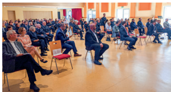
Beförderungsveranstaltung in der LPI Gotha

Beförderungstellen beträgt der Anteil dieser Beamt*innen bei den diesjährigen Beförderungen aber gerade mal zwei bis vier der möglichen Zehn-Prozent-Verteilung, die diesen Besoldungsgruppen rechnerisch zustehen würde. Besonders gering ist dieser Anteil in der Landespolizeidirektion, der Landespolizeiinspektion Saalfeld und der Landespolizeiinspektion Erfurt. Der Polizeihaushalt und die ODP müssen endlich in Übereinstimmung gebracht werden. Sonst nützt auch die in der letzten Gesetzesnovelle gestrichenen Stellenobergrenzen für den mittleren Dienst nicht wirklich etwas, wenn im Landshaushalt nicht die erforderlichen Stellen zur Verfügung gestellt werden.