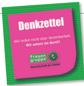
Diesjähriges Postkartenmotiv des GdP-Bezirks Bundespolizei zum Internationalen Frauentag