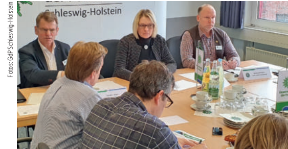
Gegenüber der Presse stellte die Landes-GdP das Positionspapier vor.

Ein Positionspapier der Gewerkschaft der Polizei Schleswig-Holstein über personelle Heraus- und Anforderungen dieses Jahrzehnts.