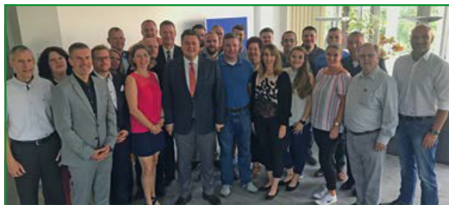
Innensenator Geisel inmitten unserer Bezirksgruppe Dir 4.

Keinen Hehl machte unser Gast daraus, dass die Investitionen in Ausstattung und Ausrüstung teilweise Maßnahmen umfassten, die schon vor-