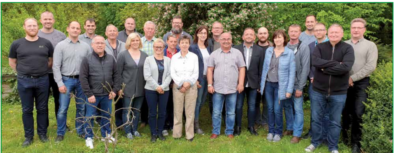
Die Delegierten der ehemaligen Bezirksgruppe PD Nord.