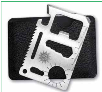
Mit diesem Multitool wurden die Kollegen begrüßt.