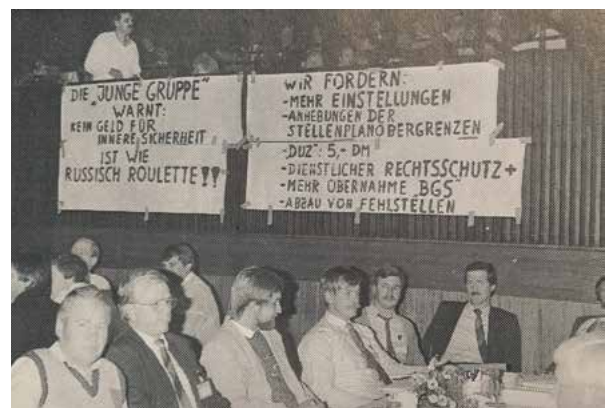
Anlässlich des 24. Landesdelegiertentags macht die JUNGE GRUPPE (GdP) mit Plakaten auf ihre Forderungen aufmerksam.