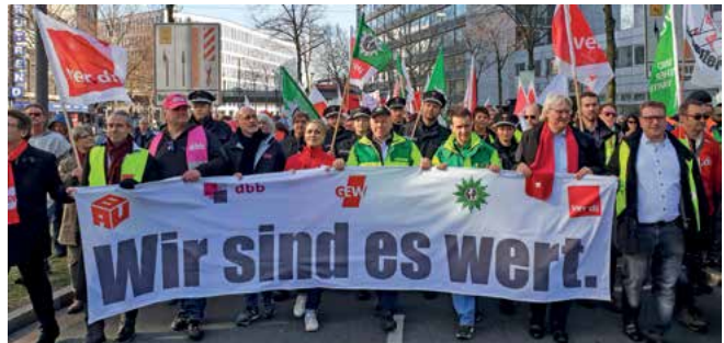
Bei der Demonstration von ver.di, GdP und GEW in Bremen anlässlich der Tarifverhandlungen demonstrierten rund 7.000 Teilnehmende für bessere Bezahlung im öffentlichen Dienst.

Wir wollen, dass die Arbeit unserer Kolleginnen und Kollegen ausreichend