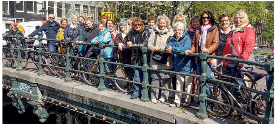
Grachten, Brücken und Fahrräder – die niedersächsischen GdP-Frauen in Amsterdam.