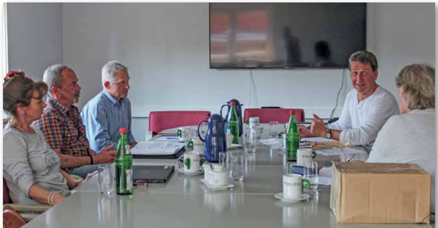
Der GdP-Fachausschuss Kriminalpolizei trifft sich regelmäßig, um sich auszutauschen und Forderungen zu formulieren.

Die GdP thematisiert seit Jahren, dass die Polizei sich intensiver mit der Aus- und Fortbildung aller Polizeivollzugsbeamtinnen und -beamten beschäftigen muss. Die Inhalte sind