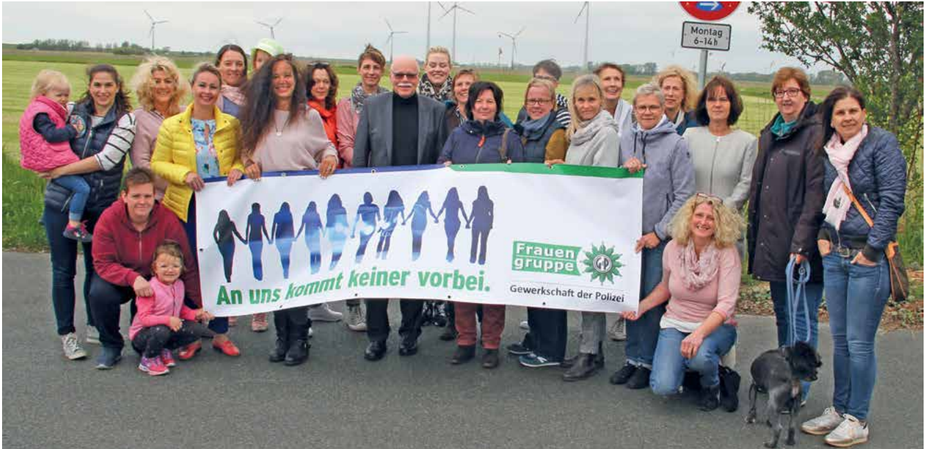
Senator für Inneres, Ulrich Mäurer, stellte sich den Fragen der Frauengruppe.

W ie fast in jedem Jahr waren die drei Tage in Tossens von Angestellten und Beamtinnen aus allen Bereichen der Innenbehörde gleich zu Jahresbeginn wieder ausgebucht.