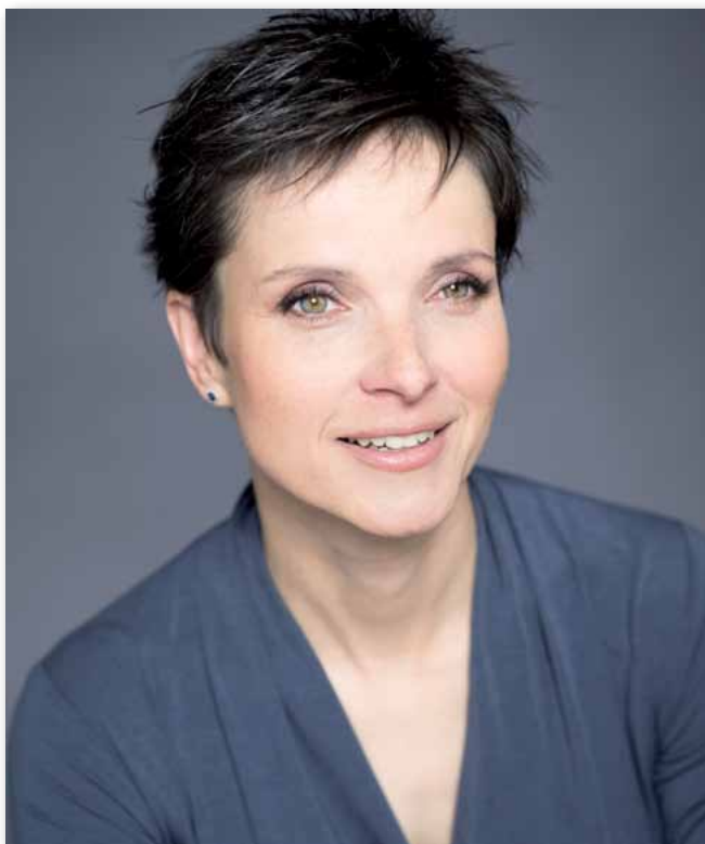
Frauke Petry (Vorsitzende Blaue Partei)

Dr. Frauke Petry: Das ist richtig. Aber der Konsens kann nicht vor der Kontroverse kommen. Der Konsens ist das Ergebnis einer Diskussion und nicht der Anfangspunkt. Sie haben konkret gefragt, was müssten wir ändern? Eigentlich ist es nicht so schwierig. Ich versuch es meinen Kindern jeden Tag beizubringen, auch wenn sie sich streiten, denjenigen, der eine andere Meinung hat, trotzdem mensch-