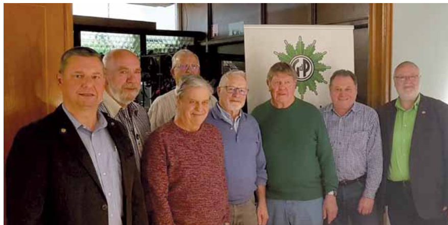
Ehrung 50 und 65 Jahre Gewerkschaftszugehörigkeit

Nach dem Pflichtteil der Veranstaltung, der mit der Entlastung des Vorstands und der Nachwahl eines Kassenprüfers schloss, gab der Vorsitzende einen Überblick über die strategische Ausrichtung der Bezirksgruppe. Schwerpunkt waren die nöti-