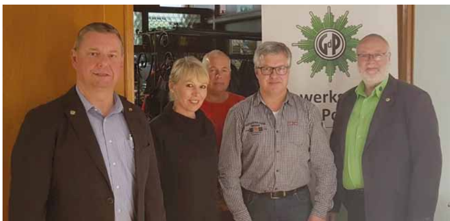
Ehrung 25 Jahre Gewerkschaftszugehörigkeit