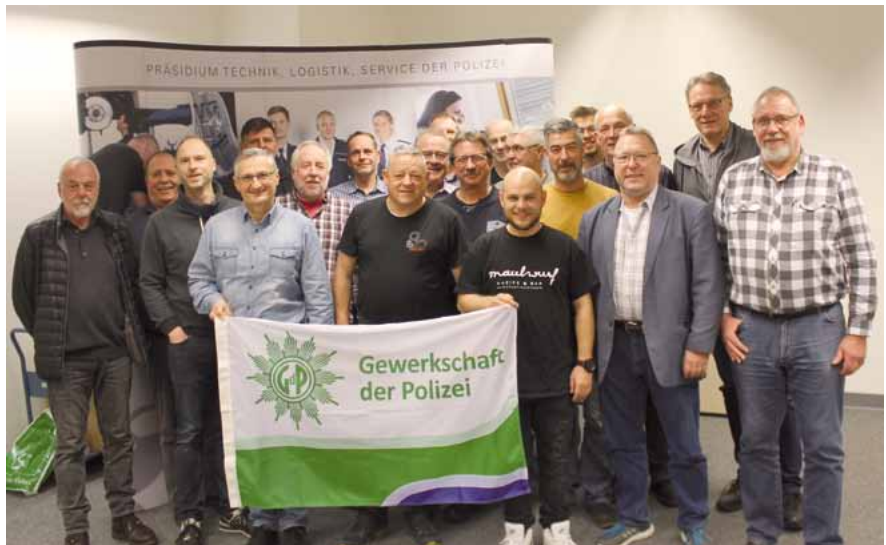
Gruppenbild der Teilnehmer