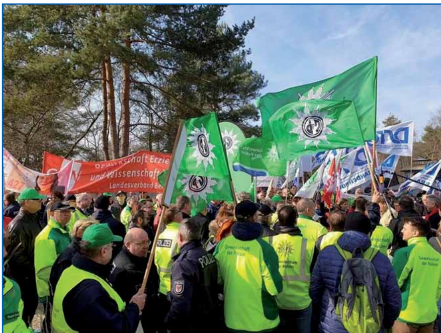
Über 200 Kolleginnen und Kollegen der GdP-Brandenburg vor Ort

Dafür möchte ich mich persönlich noch mal ganz herzlich bei euch allen bedanken.