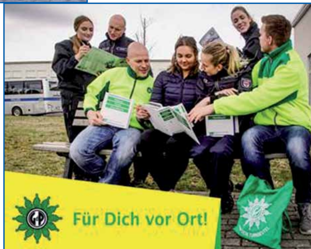
GdP – immer für dich da

Neben dem Vorstand der Kreisgruppe FHPol findet ihr auch unter den Anwärterinnen und Anwärtern engagierte GdP-Mitglieder und Vertrauensleute, die euch gerne mit Rat und Tat zur Seite stehen.