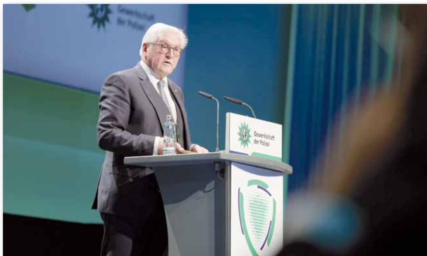
Bundespräsident Steinmeier mit eindrücklichen Botschaften