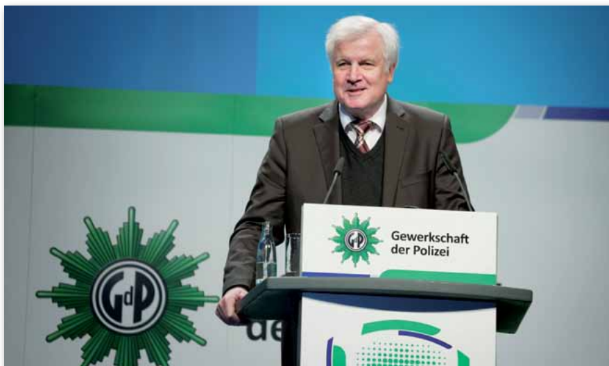
Bundesinnenminister Seehofer nahm launig Stellung