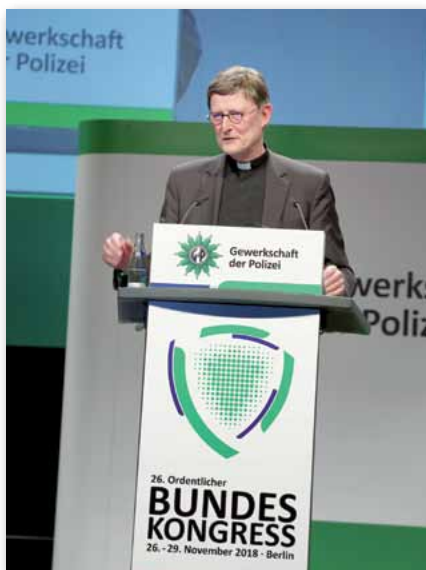
Kardinal Woelki beeindruckte mit einer etwas anderen Sicht der Dinge

Diesen Worten mag man kaum etwas hinzufügen.