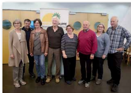
Der neue Vorstand des FB Senioren