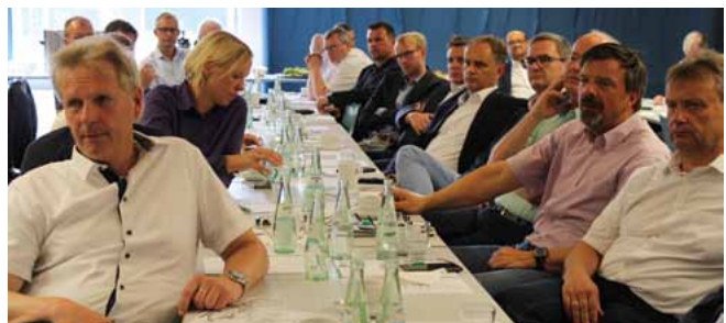
Rund 60 Führungskräfte nahmen an der 7. GdP-Fachtagung hD teil.