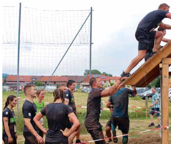
Beim Keilerrun mussten die Teams verschiedenste Hindernisse überwinden.