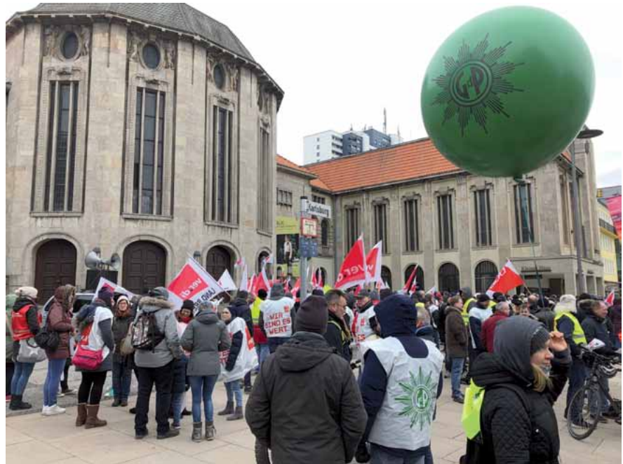
Ca. 500 Mitglieder der verschiedenen DGB-Gewerkschaften beteiligten sich am Streik in Bremerhaven.

Trotz des massiven Personalabbaus im öffentlichen Dienst sind staatliche Leistungen stets zuverlässig von den Bürgerinnen und Bürgern abrufbar. Es können keine Zweifel daran bestehen, dass der öffentliche Dienst in unserem Land elementare Aufgaben wahrnimmt. Unser hochentwickeltes Gesellschaftssystem ist eine Errungenschaft, die mittlerweile ganz maßgeblich vom persönlichen Engage-