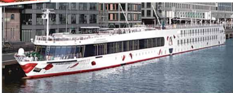
Ihr Schiff A-Rosa Silva