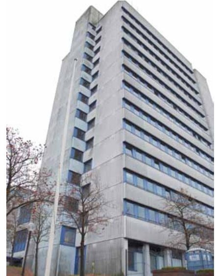
Das marode Dienstgebäude „Große Paaschburg 66“.