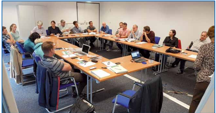
Mentees und Mentoren/Mentorinnen trafen sich zum Austausch von Erwartungshaltungen und legten Spielregeln fest.

Vor den Tandems liegt eine spannende und arbeitsreiche Zeit, die wir in den kommenden zwölf Monaten be-