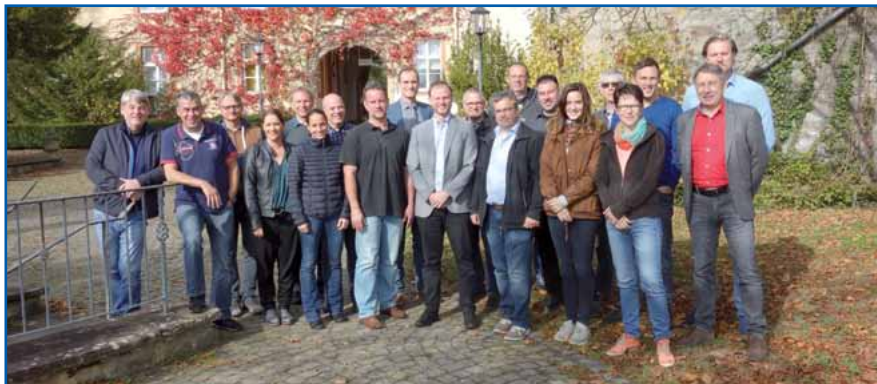
Teilnehmerinnen und Teilnehmer sowie Referenten des „Workshop S & K“ 2017

Dazu wurde ein Forderungskatalog erarbeitet, der der GdP als Arbeitsgrundlage dienen wird.