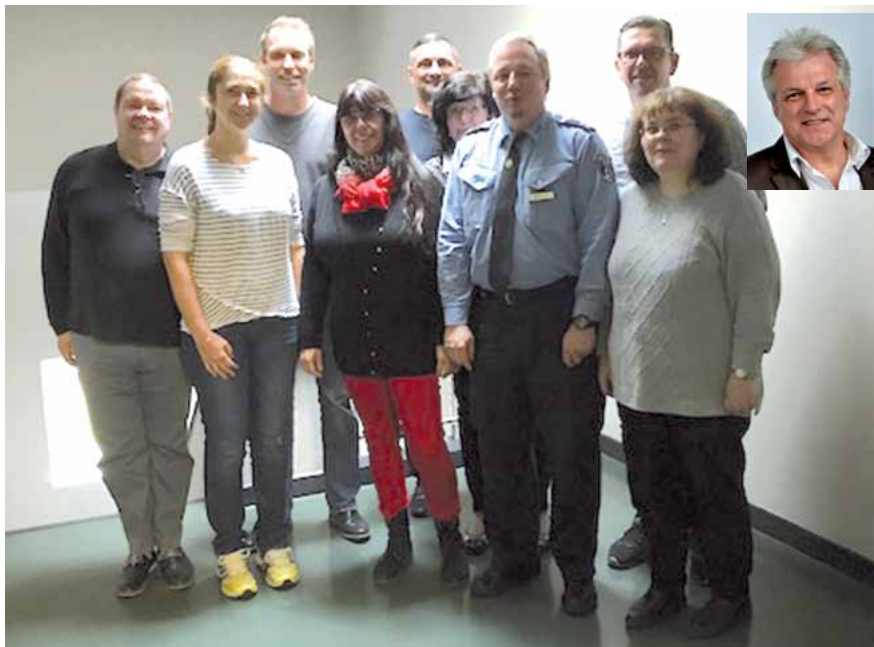
Der neue Bezirksgruppenvorstand der Direktion 5 – Nicht im Bild: Rainer Hadan.