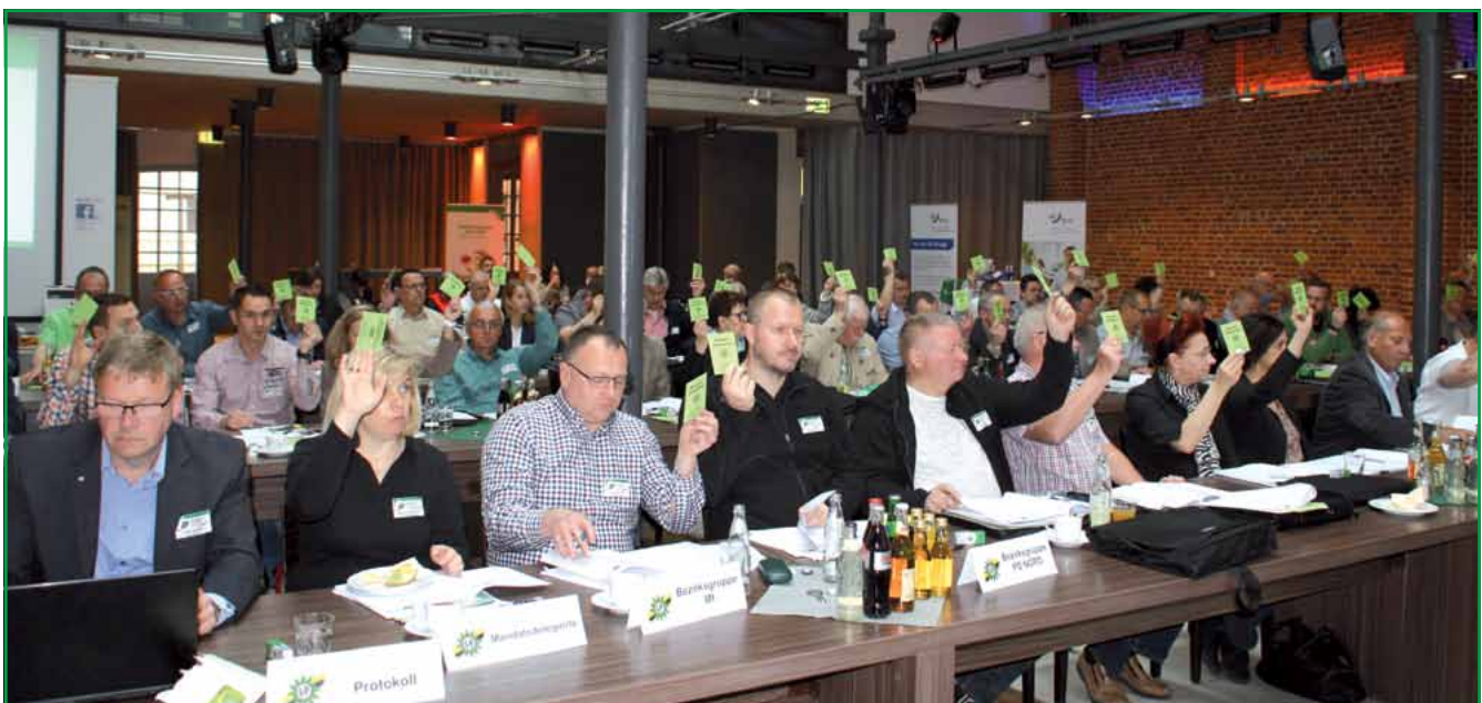
Auf dem außerordentlichen Landesdelegiertentag am 5. 5. 2017 in Magdeburg wurden mehrere Positionen für den geschäftsführenden Landesvorstand (GLBV) nachgewählt.