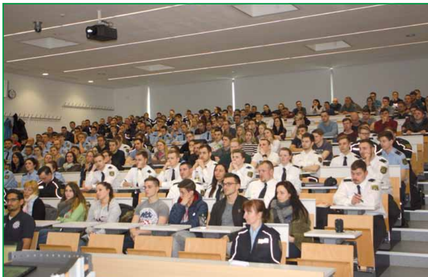
Der Hörsaal der FH hat knapp 300 Sitzplätze. Dies reicht bei der jetzigen Einstellung bei Weitem nicht aus.

Es gibt gleich mehrere Gründe, dass wir uns auf die Vielzahl der Praktikanten freuen können. Langfristig gesehen sind diese Praktikanten das Licht am Ende eines noch langen Tunnels. Mit der Beendigung der Ausbildung und des Studiums des Jahrganges 2017, mit ca. 700 neuen Kollegen, werden wir den unsäglichen Personalab-