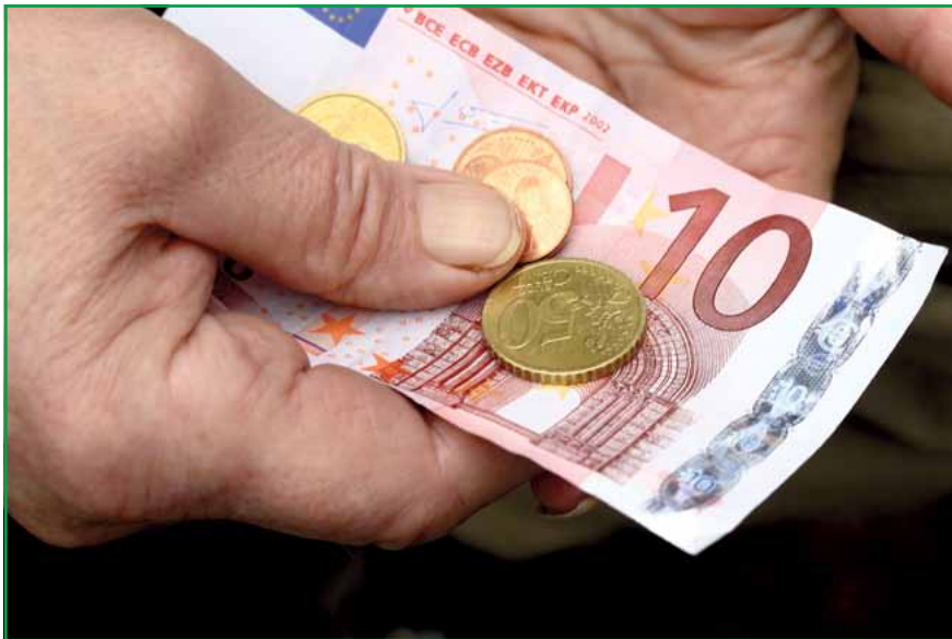
Beim Gesetzentwurf geht es um viel mehr als nur um die Besoldung der Landesbeamten.