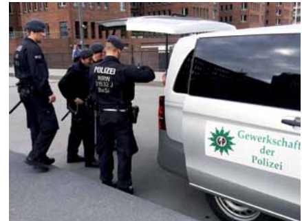
Einsatzkräfte stärken sich bei den Einsatzbetreuern der GdP Niedersachsen.

Gegen Mitternacht ging es für die niedersächsischen Einsatzbetreuer zurück in die Unterkunft. Als sie am nächsten Tag, dem Gipfel-Freitag, gerade zur erneuten Versorgung der Einsatzkräfte aufbrechen wollten, kam die Nachricht „Sofort abbrechen und nach Hause fahren“. Die Schreckensmeldungen von verletzten Kolleginnen und Kollegen, von den Ausschreitungen und vom Chaos hatten die Einsatzbetreuer die ganze Zeit schon immer über das Handy verfolgt. „Dann wurde es aber zu unübersichtlich, und die GdP-Zentrale hat abgebrochen“, erzählt Wolfgang