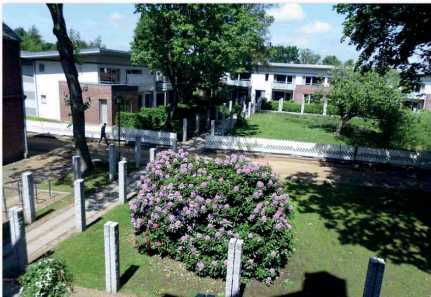
Lädt zum Erholen und Arbeiten ein

In der Nähe von Bredstedt liegt das Christian-Jensen-Kolleg „CJK“ in der Kirchenstr. 4–13. Dabei handelt es sich um ein Bildungszentrum der Nordkirche, das eine Vielzahl an Bil-