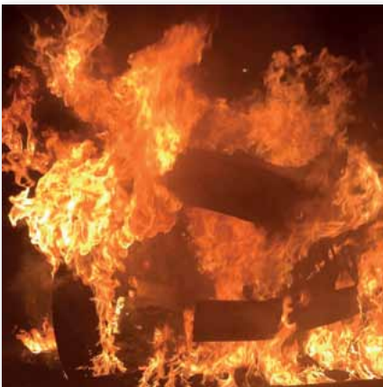
Dies ist durch nichts zu rechtfertigen

In der Nacht auf den 17. März wurde ein Brandanschlag auf Einsatzfahrzeuge der Hamburger Polizei verübt. Wieder war es ein feiger krimineller Angriff. Wer die Polizei angreift, greift den Staat und damit uns alle an. Ich erwarte insbesondere von den Vertretern der Linkspartei in dieser Stadt eine unzweideutige und öffentliche Verurteilung dieser kriminellen