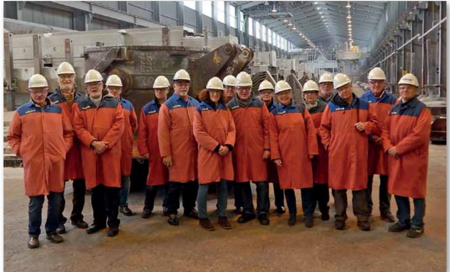
Entsprechend bekleidet zu Gast bei Trimet: Die GdP-Teilnehmer