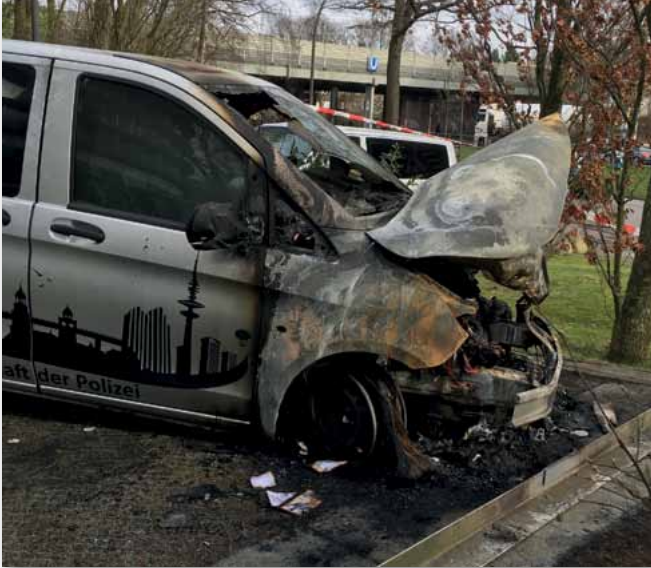
Das Ergebnis blinder Zerstörungswut