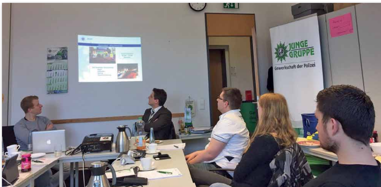
Meinungsaustausch und Themenvielfalt

treuung. Ein Referent des Vorbereitungsstabs G 20 erläuterten den OSZE- und G 20-Einsatz. Am frühen