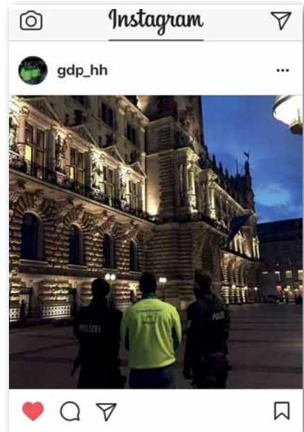
Auch auf Instagram: gdp_hh

rend und mit Kolleginnen und Kollegen, die sich neben ihrem Dienst ehrenamtlich und in ihrer Freizeit für Euch engagieren. Gestern Nacht hatte ich Kontakt zu Objektschutzkräften – die Lösung der Verpflegungs- und Versorgungsfrage ist ein wesentliches Thema. Es mag sein, dass die aktuelle Verpflegungsrichtlinie dies nicht hergibt – entscheidend ist aber der politische Wille, dem Polizeiführer und seinen Kräften die gestellte Aufgabe ein wenig erträglicher zu machen. Außergewöhnliche Situationen erfordern außergewöhnliche