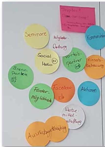
Es gibt genug Themen, die bearbeitet werden wollen

nig, dass das Treffen nicht nur erfolgreich sondern auch motivierend für die kommende Zeit war. Da es in den Landesbezirken oftmals von Vorteil ist, Unterstützer aus anderen Bundesländern zu haben, um Ideen und Wünsche umzusetzen, ist es für uns wichtig, unsere Arbeit gegenseitig zu unterstützen und füreinander einzustehen. Die Mitglieder der JUNGEN GRUPPE (GdP) machen einen nicht unbedeutenden Anteil der Gewerkschaft der Polizei (GdP) aus und daher ist es wichtig, unsere Arbeit weiter aufrechtzuerhalten und unsere Forderungen voranzubringen.