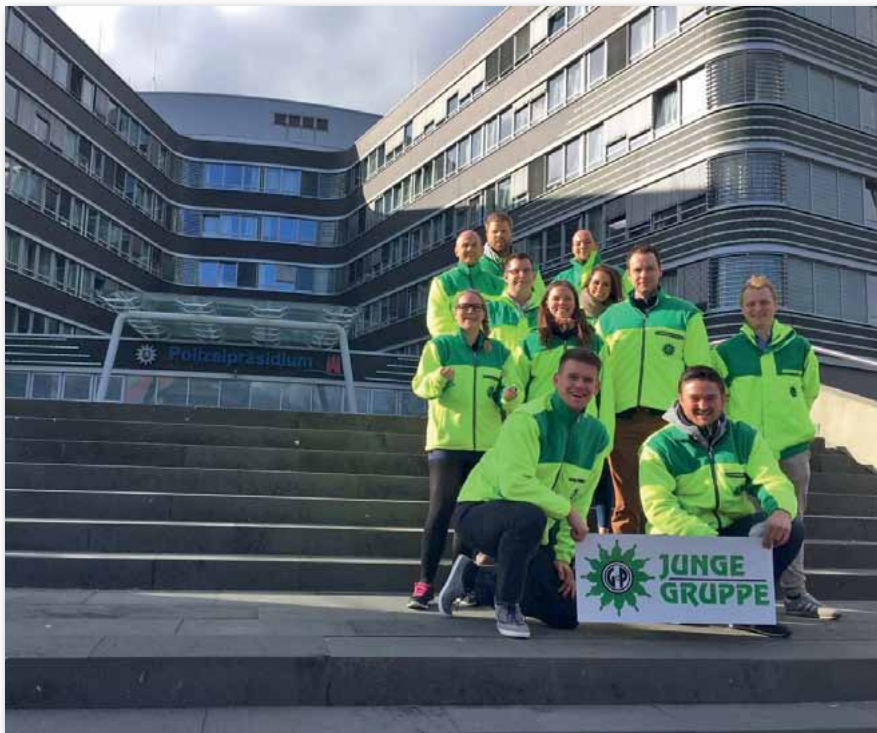
Die Teilnehmer vor dem Hamburger Polizeipräsidium

Vertreter aus Schleswig-Holstein, Niedersachsen, Bremen, Mecklenburg-Vorpommern sowie natürlich Hamburg konnten an zwei Tagen Problemfelder zusammentragen und diskutieren. Zu unserer Tagesordnung gehörten die Themen G 20,