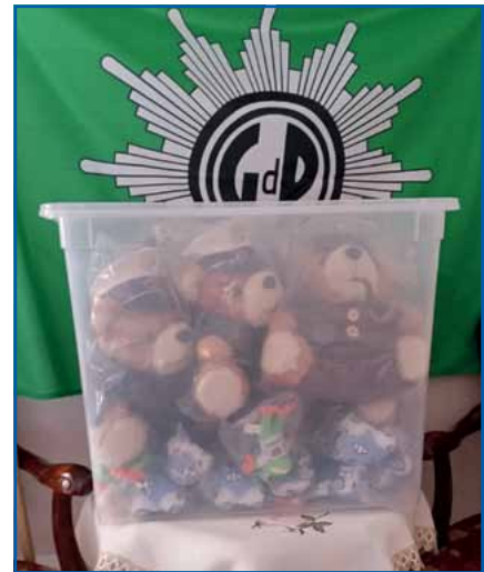
Teddys für ein Kinderlächeln

ein gebeten. Diesem Aufruf kamen die Besucher gerne nach. Durch die Öffentlichkeitsarbeit des Verschönerungsvereins gelangte diese Information zu uns, der Kreisgruppe der GdP des ZDPol. Für uns als Kreisgruppe stand sofort fest, auch wir werden helfen. In einem gemeinsamen Beschluss wurden kleine Geschenke für ein Kinderlächeln im Wert von 150 Euro bestellt und diese Geschenke wurden am 2. April im Rahmen des Benefizkonzertes durch einen Vertreter unserer Kreisgruppe an den Verein übergeben. Somit ein toller Erfolg für die GdP-Kreisgruppe des ZDPol. Nicht nur die Sonne strahlte an diesem Tage, sondern auch die Kinderaugen.