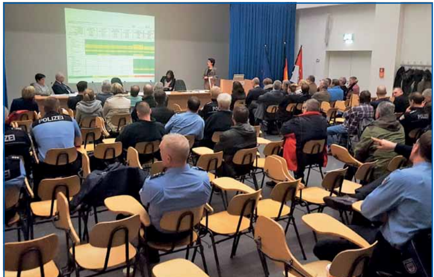
Präsentation der Ergebnisse

Zuerst wurde eine Voruntersuchung in der Raumschießanlagen (RSA) Eberswalde durchgeführt. In Orientierungsmessungen wurde