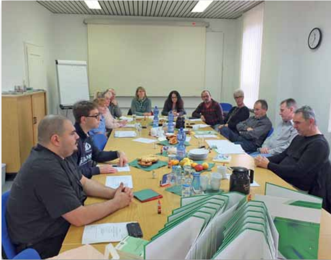
Ein wieder gut besuchtes Tarifforum Ende November 2016 in Saarbrücken

GdP-Tarifbeschäftigte gestalten mit und tauschen sich aus!