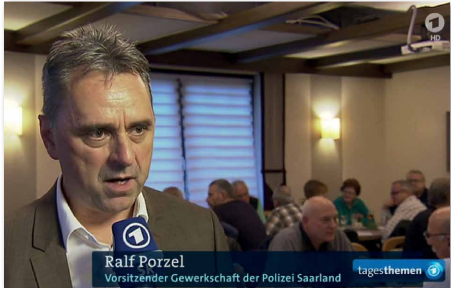
Die GdP Saarland ist ein gefragter Ansprechpartner der Medien! Der Landesvorsitzende im ARD-Tagesthemen-Interview zum Thema „Zunehmende Gewalt gegen Polizisten“. Das Gespräch wurde von der ARD auf der Jahresmitgliederversammlung der KG St. Wendel in Steinberg-Deckenhardt aufgezeichnet.

Ein wichtiges, richtungsweisendes Signal für das vor uns liegende Jahr 2017, in dem es gilt, diesen positiven Schwung mitzunehmen. Wir haben auch keine Zeit zu verlieren, denn wir stecken schon mitten in den Vorbereitungen der Personalsrastwahlen 2017 sowie der Wahl der Frauenbeauftragten. Es gilt Wahlvorstände zu organisieren, zu schulen und die organisatorischen Vorbereitungen zu treffen.