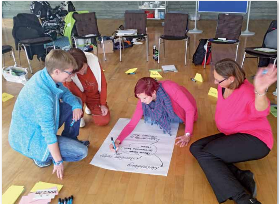
Die Seminarteilnehmerinnen bei der Arbeit

Im Seminar ging es darum, die Frauen bei ihren alltäglichen Belastungen und ihren individuellen Bewältigungsstrategien zu unterstützen und diese mit professionellen Tipps und Ratschlägen von „Coach“ Manuela Rukavina zu untermauern und zu erleichtern. Thematisch wurden im Seminar einzelne – jedoch bedeutungsvolle Punkte, wenn es sich um das Thema Stressbewältigung dreht – behandelt. Diese waren z. B. Entstehung von Stress sowie die unterschiedlichen Formen der Kommunikation und beispielsweise wo ver(sch)wende ich meine Energie. Nach einem arbeitsintensiven Tag ging jede Seminarteilnehmerin gestärkt wieder ruhiger und stressfreier in ihre Alltagsbewältigung.