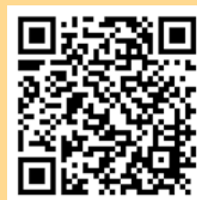
QR-Code zum Bericht der Kochbegegnung 2015