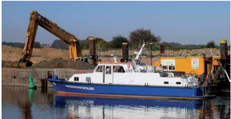
Nienburger Dienstboot auf der Weser.

Die WSP-Dienststellen in Hannover, Nienburg, Meppen und Scharnebeck wurden zu WSP-Stationen. Die Koordinierungsstelle im Stab der WSPI in Oldenburg übernimmt in en-