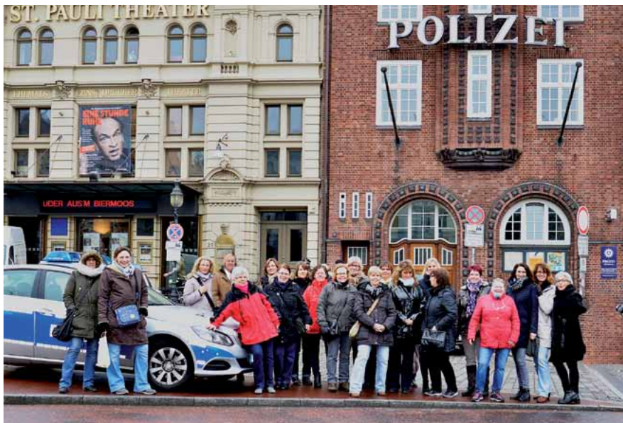
Frauengruppe vor der Davidwache in Hamburg im Frühjahr 2016.

Da es sich am besten miteinander denn alleine spricht, organisiert die GdP-Frauengruppe für interessierte Gewerkschafterinnen die nächste „Frauen fahren fort“-Tour. Vergangenen Februar ging es in den hanseatischen Norden. Nun ist die Bundeshauptstadt das nächste Fahrtziel. Vom 10. bis 12. März 2017 gibt es in Berlin ein umfangreiches gewerkschaftspolitisches Programm, wobei neben dem Besuch der Bundesgeschäftsstelle auch ein Treffen mit niedersächsischen Vertretern im Bundestag geplant ist. Mit einer Fahrt auf der Spree und einem Ausflug zum größten Trödelmarkt Euro-