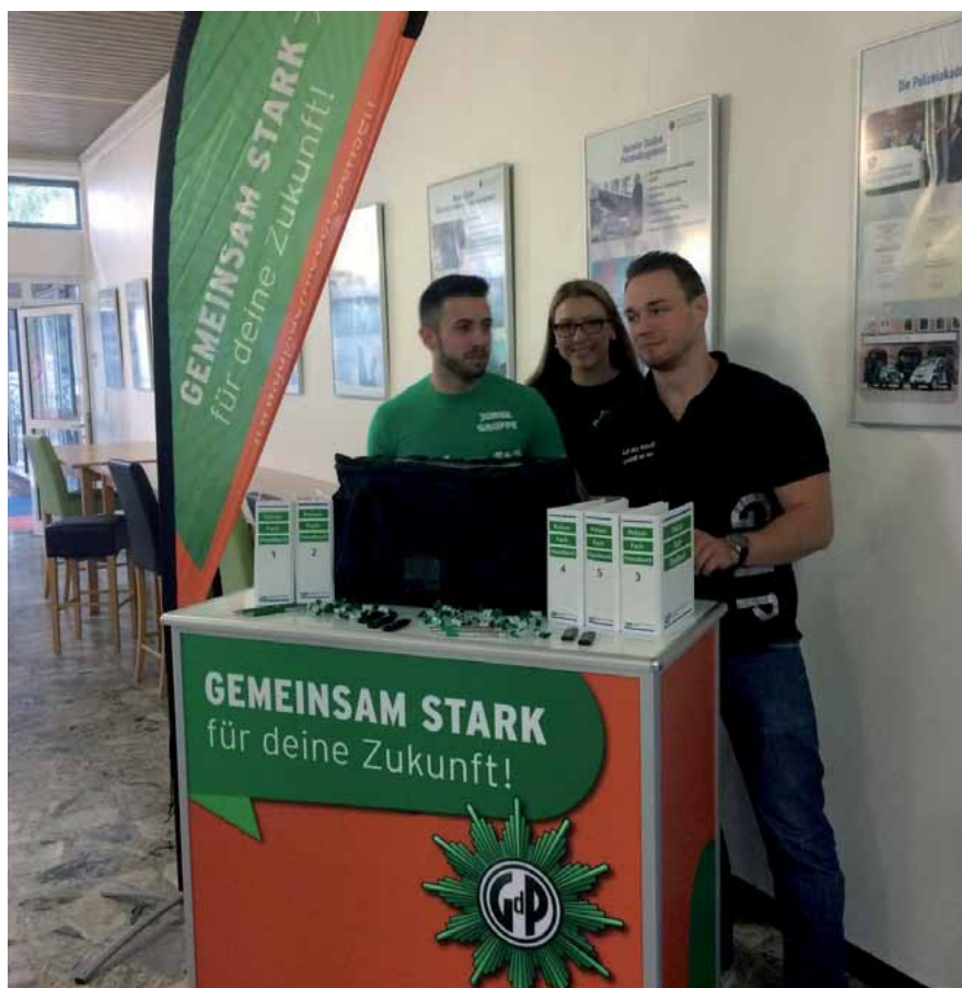
Informationsstand der GdP zur „Stunde der Gewerkschaft in Nienburg“.

einer Mitgliedschaft in der GdP informiert. Neben der Literaturdatenbank war die landesweite Präsenz und Ansprechbarkeit der GdP überzeugend. Dies wurde auch direkt vor Ort unter Beweis gestellt: Ein Team von elf Vertreterinnen und Vertretern des Landesjugendvorstandes stand für die Fragen der Anwärterinnen und Anwärtern zur Verfügung. Bei einem Snack in der Cafeteria „Caponi“ wur-