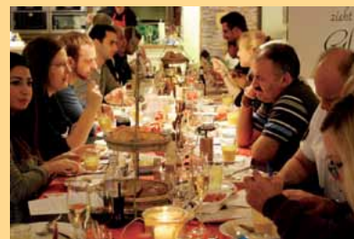
Kochbegegnung zwischen Flüchtlingen und Polizeibeamten im Jahr 2015

Am 22. November 2016 (16.30 bis 21 Uhr) bietet das Landesbüro Niedersachsen der Friedrich-Ebert-Stiftung wieder acht Polizei-beschäftigten die Möglichkeit, gemeinsam mit Migrantinnen und Migranten in Nienburg unter fachlicher Anleitung zu kochen und sich auszutauschen.