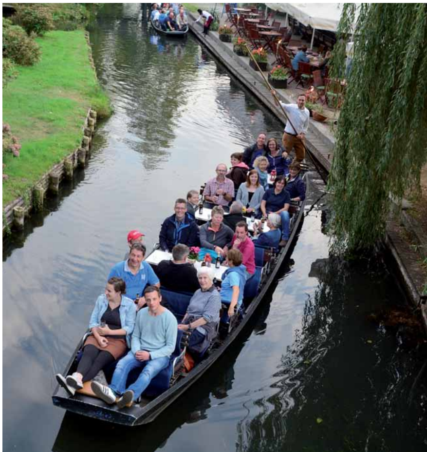
GdP-Mitglieder des LKA lassen sich durch das idyllische Spreewalddorf Lehde „staken“.