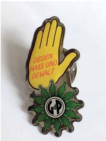
Logo der Gelben Hand zusammen mit dem GdP-Stern

Der DGB und die Einzelgewerkschaften im DGB, also auch die GdP, sind Mitglied des „Kumpelvereins“.