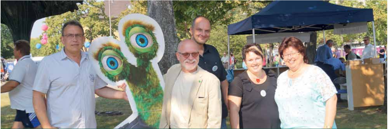
Das atemberaubende Wetter und die vielen freundlichen Gäste zauberten ein Lächeln in die Gesichter aller Beteiligten.