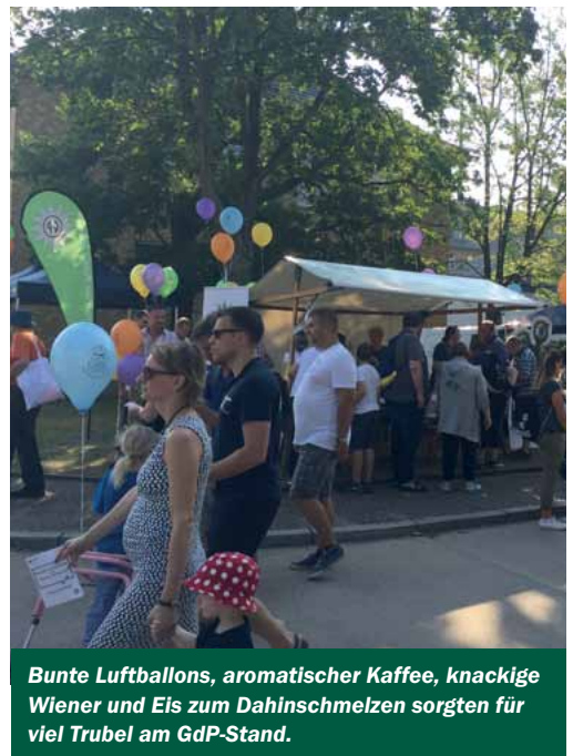
Bunte Luftballons, aromatischer Kaffee, knacklige Wiener und Eis zum Dahinschmelzen sorgten für viel Trubel am GdP-Stand.