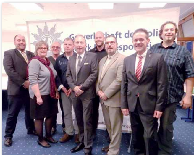
Der Vorstand der GdP-GVP bittet für die bevorstehenden Personalratswahlen um einen GdP-Vertrauensvorschuss im BAG. Wir können und wollen alle Mitarbeiter des BAG mit Kraft und auf Augenhöhe mit der Dienststelle vertreten.