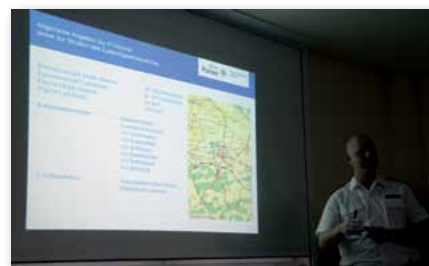
Weimar aus polizeilicher Sicht

Der polizeiliche und politische Bezug zog sich durch die nächsten Termine. Am Dienstagnachmittag, der Besuch bei der Polizeistation in Weimar. Mit Kurzbesichtigung und Fototermin, auf dem Fußweg dort hin, am einzigen z. Zt. dauerbesetzten Haus, mit einigen der Bewohner, einer linken Szene, ganz spontan! Der stellv.