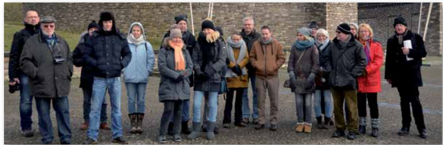
Bedrückende Geschichte: KZ Buchenwald