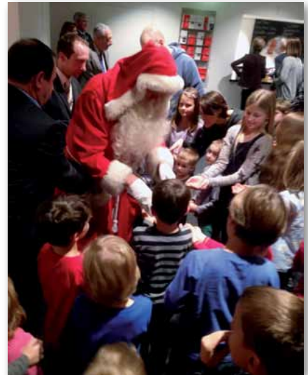
Der Weihnachtsmann hatte für jeden eine kleine Aufmerksamkeit.