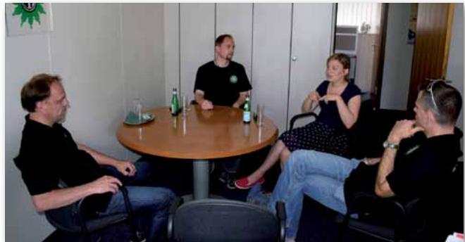
Auch die Grünen-MdL Katharina Schulze begleitete das GdP-Betreuungsteam einen Tag lang.

Wir möchte es aber auch nicht versäumen, den vielen friedlichen, gewaltfreien und engagierten Demonstranten zu danken, die mit bunten und kraftvollen Aktionen dazu beigetragen haben, dass die Proteste auch inhaltlich wahrgenommen und nicht