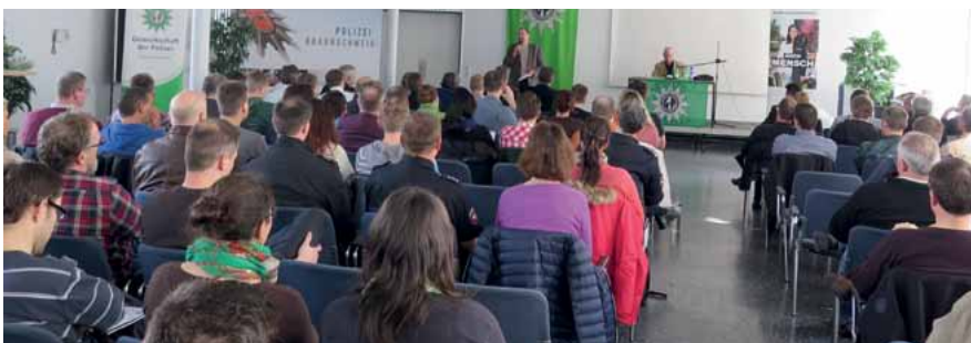
Interessierte Beschäftigte in Braunschweig

Seit 1984 veröffentlichte er zu den Themen Soziale Arbeit, Drogenhilfe, Rauschgift- und organisierte Kriminalität sowie Terrorismus zahlreiche Bücher und Fachaufsätze. Dazu hält er Vorträge, auch zur Weiterbildung in Landespolizeischulen und bei der Bundeswehr.