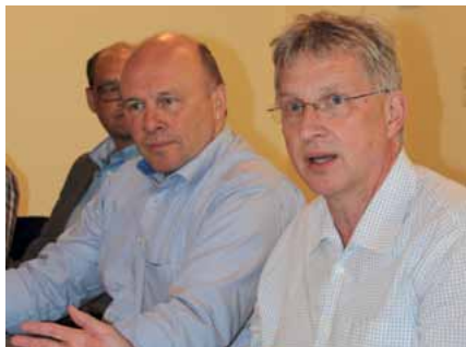
Knut Lindenau (rechts)

Ende April 2015 hatte der Landesvorstand der GdP Niedersachsen auf seiner Sitzung in Hannover Landespolizeidirektor Knut Lindenau zu Gast. Neben dessen ausführlichem Referat mit anschließender Diskussion befasste sich das Gremium auch mit der Flüchtlingssituation und ihrer Bedeutung für die Landespolizei (siehe dazu auch die Ankündigung einer Fachtagung zum Thema in dieser Ausgabe des LandesJournals).