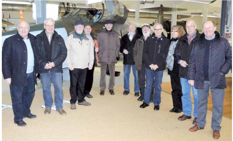
Gruppenaufnahme vor dem Starfighter

Weitere Ausstellungsstücke waren der Motorentwicklung bis hin zu neuesten Triebwerken gewidmet. Viele kleine und größere Flugobjekte ha-