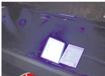
UV-Licht im Handschuhfach

Die Prüfung von Sicherheits- und Fälschungsmerkmalen bei Dokumenten genießt im Rahmen der polizeilichen Arbeit einen hohen Stellenwert. Totalgefälschte oder verfälschte Dokumente werden meist für folgenschwere Straftaten (wie zum Beispiel Kreditbetrug, Kontoeröffnungsbetrug, sozial-, ausländer- und versicherungsrechtliche Verstöße) verwendet und verursachen unter anderem beträchtliche wirtschaftliche Schäden.