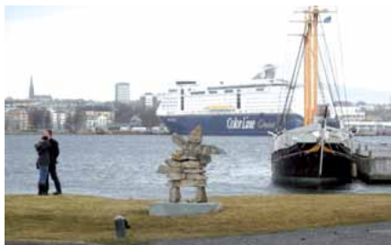
Die GdP-Frauen auf großer Fahrt.