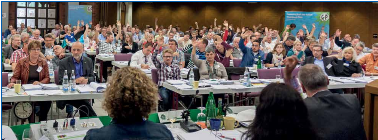
Das GdP-Programm fand nach eingehenden Diskussionen und zwei Änderungen die breite Zustimmung der Delegierten.

Der 22. Delegiertentag der GdP hat nach monatelanger Diskussion in allen Untergliederungen und mit zahllosen Fachleuten das Programm „GdP. Wir gestalten Zukunft. POLIZEI 2026“ verabschiedet.