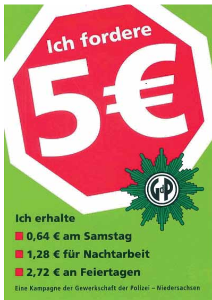
Das Motiv von 2008.