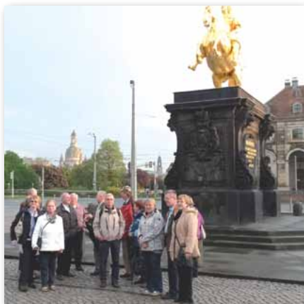
Treff am „Goldenen Reiter“

höfe der Neustadt rund um die Dreikönigskirche führte. Am Eiscafe „Venezia“ gab es von der Chefin einen kleinen Umtrunk, bevor die Wanderung über das Volkskunstmuseum zum Japanischen Palais fortgesetzt wurde. Vom Elbufer aus genoss man noch einmal den wunderbaren abendlichen Canaletto-Blick, wo sich