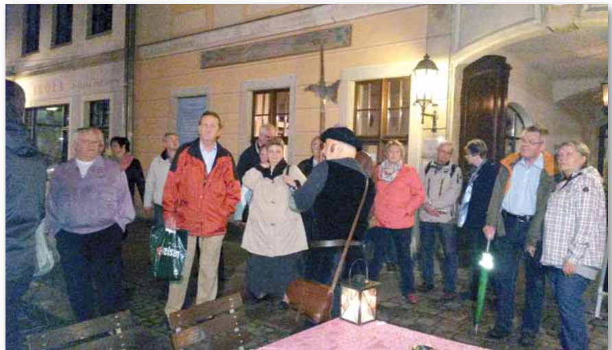
Mit dem Nachtwächter in den historischen Gassen

Zunächst stärkte man sich im ehemaligen historischen Kartoffelkeller, aus dem wir vom Nachtwächter im historischen Outfit abgeholt wurden, der dann durch die barocken Hinter-