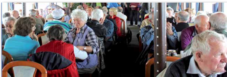
Impressionen von der Seniorendampferfahrt 2013