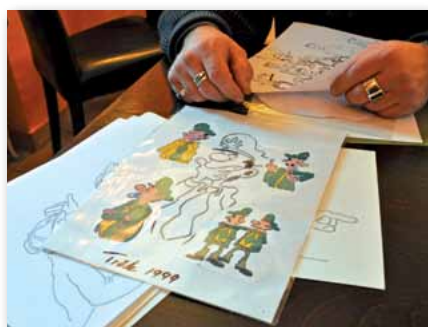
Immer wieder gern genommen: Themen aus dem Bereich der Polizei

toons, rauf und runter. Zuletzt für die Redaktion der „Deutschen Polizei“, weil wir eine Gallionsfigur für unsere wiederbelebte Rubrik „Meier“ brauchten. Seit der letzten Ausgabe (DP 11/2013) hat unser Meier 4.0 nun ein Gesicht – und unsere Absicht ist, auch seinem „Schöpfer“ selbiges zu geben. Wer also ist eigentlich dieser Trölle? Wie wird ein Polizist zum Cartoonisten? Bei diesem Mann war das ganz einfach: Erst kam das Zeichnen, dann die Polizei und dann die Zeichnungen mit Polizei. Fer-