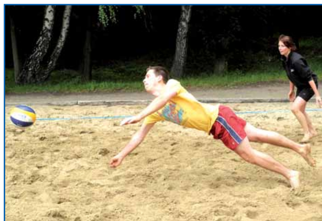
Mit vollem Einsatz

Der Landesjugendvorstand der Jungen Gruppe GdP bedankt sich auch bei allen Helfern und vor allem bei den Teilnehmern. Es hat Spaß gemacht!!