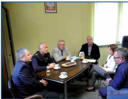
Bei der Übergabe der Spende

Insgesamt sind dabei fast 4000 Euro zusammengekommen.