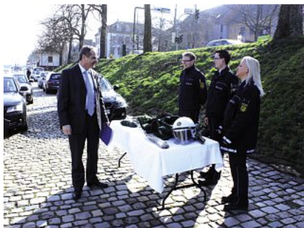
Die Junge Gruppe präsentierte den Journalisten die Körperschutzausstattung (KSA), hier im Gespräch mit Innenminister Reinhold Gall