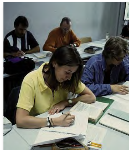
Theorie ohne ausreichende Praxis macht aus unseren Studenten noch keine Polizisten

frachtung von Theorie zulasten der praktischen Ausbildung gesellen sich Unterrichtsausfälle, eine falsche Gewichtung der theoretischen Inhalte, teilweise schlechte Vorbereitung auf anstehende Prüfungen, eine mangelnde Anbindung der Studierenden an den Polizeiberuf und vieles mehr.“