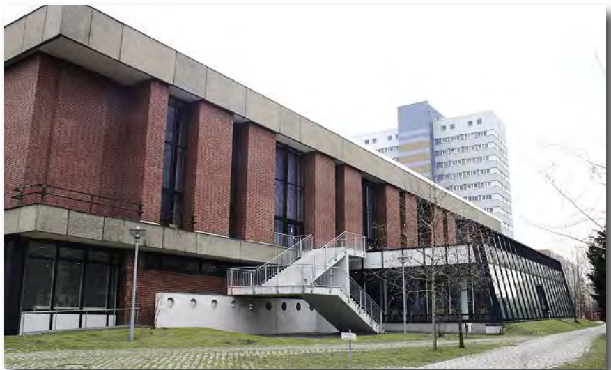
Auf dem Campus Lichtenberg der Hochschule für Wirtschaft und Recht studieren die Anwärterinnen und Anwärter für den gehobenen Dienst der Schutz- und Kriminalpolizei.